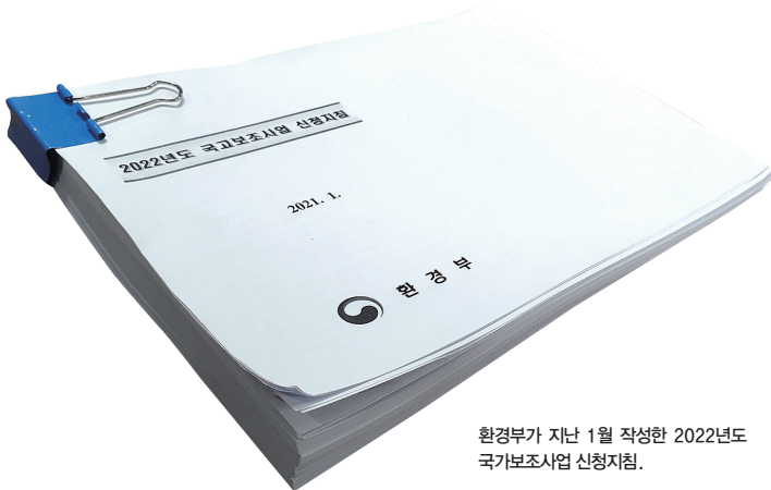
환경부가 지난 1월 작성한 2022년도 국고보조사업 신청지침.

수질오염총량제란 환경부가 1998년 물관리종합대책의 하나로 도입한 제도로 차치단체별로 목표 수질을 설정한 뒤 이를 달성하고 유지할 수 있도록 오염물질의 배출 총량을 관리 규제하고 있다. 참여 지자체에겐 오염물질 관리에 필요한 시설 설치비를 지원하고 지역 개발에서 환경규제를 완화해주는 혜택을 주고 있다.