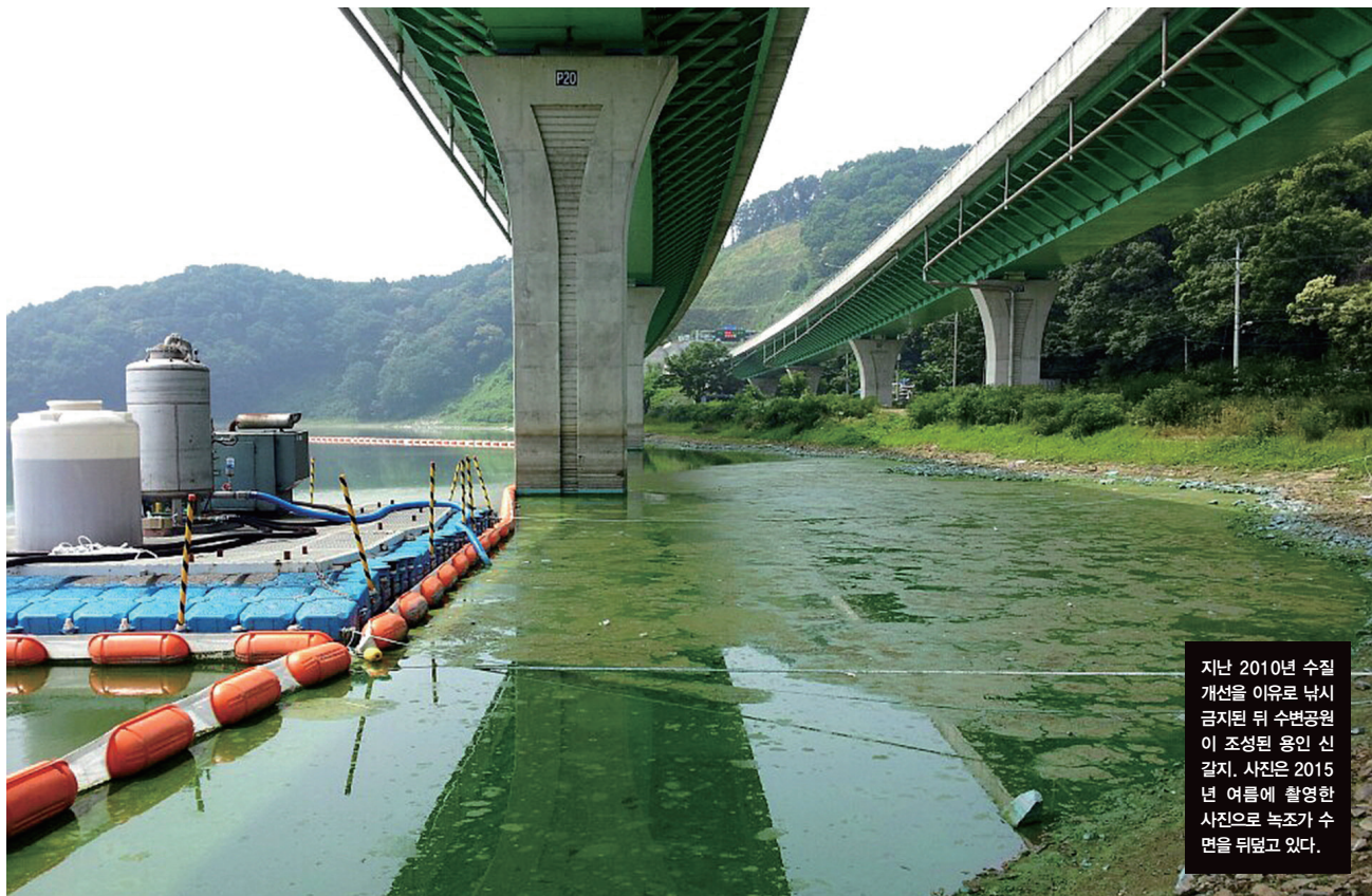
지난 2010년 수질 개선을 이유로 낚시 금지된 뒤 수변공원이 조성된 용인 신갈지. 사진은 2015년 여름에 촬영한 사진으로 녹조가 수면을 뒤덮고 있다.