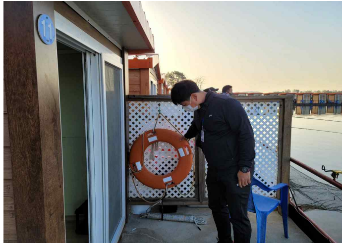
〈 낚시터 안전장비 현황 점검 〉