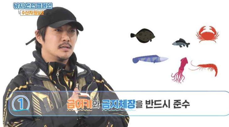
< 수산자원보호편 >