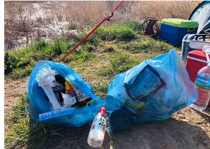
〈 낚시터 주변 방치쓰레기 수거 〉