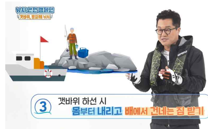
< 갯바위, 방폐제 낚시 주의사항편 >